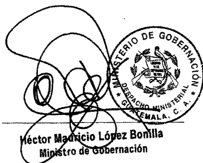
Héctor Madrid López Bonilla Ministro de Gobernación